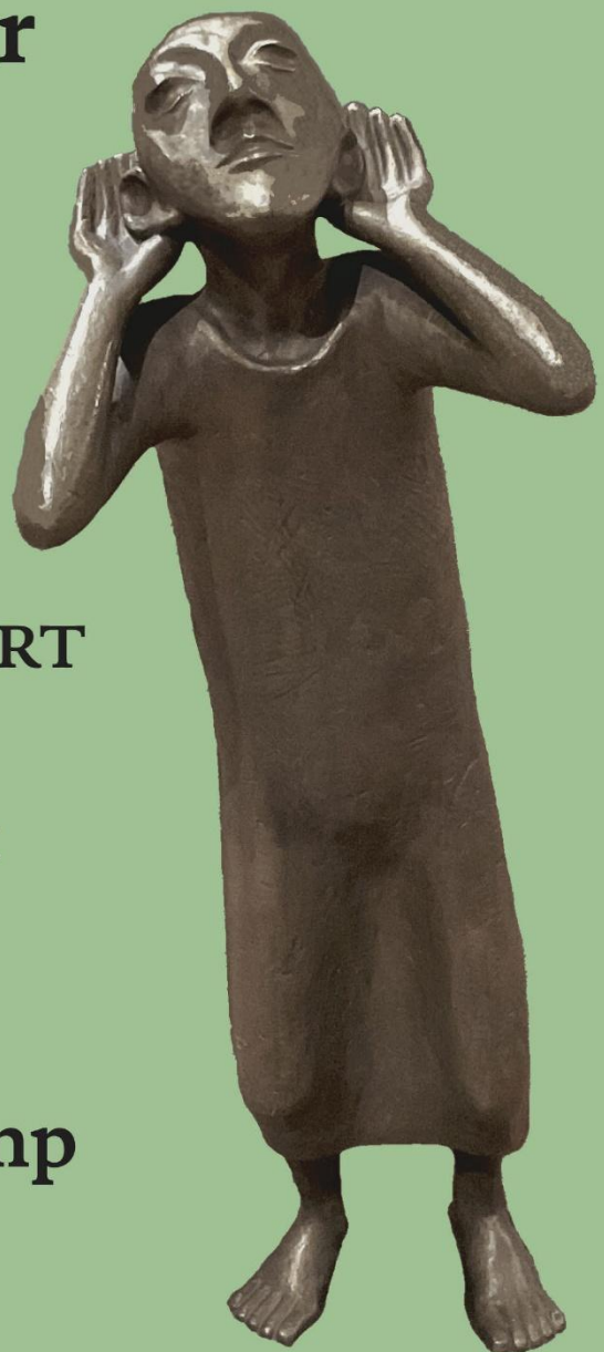
Statue „Der Hörende“ Künstler: Toni Zenz Ambo St. Gereon Köln-Merheim